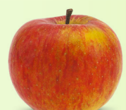
Topaz mittelgross, fest Oktober – Juli süss-säuerlich