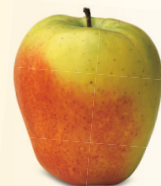
Glockenapfel mittel bis gross, saftig November – Juli säuerlich