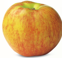
Gravensteiner mittel bis gross, sehr saftig August – Oktober säuerlich