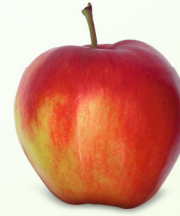
Galmac mittelgross, saftig Juli – August süss-säuerlich