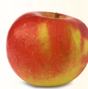
Diwa® Syn. Milwa, Junami® mittelgross, saftig Oktober – Juni eher säuerlich