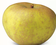
Kanada Reinette mittel bis gross, saftig Oktober – Mai säuerlich