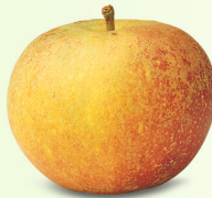
Cox Orange mittelgross, saftig, würzig September – Februar eher säuerlich