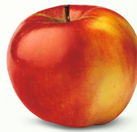
Primerouge mittelgross, saftig August – September süss-säuerlich