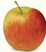
Jonagold gross, saftig, knackig September – August süsslich