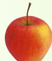
Pinova mittelgross, fest, saftig Oktober – Juni süss-säuerlich