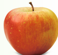
Kidd's Orange mittelgross, fest, knackig September – Januar eher säuerlich