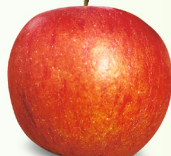
Braeburn mittelgross, fest, knackig Oktober – Juni süss-säuerlich