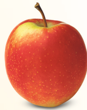
Summerred mittelgross, saftig August – Oktober süss-säuerlich