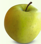
Golden Delicious gross, knackig September – August süsslich