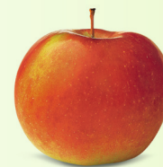
Idared mittel bis gross, saftig Oktober – Mai süsslich