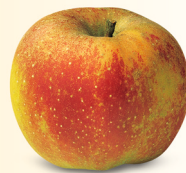
Boskoop mittel bis gross, saftig September – Mai säuerlich