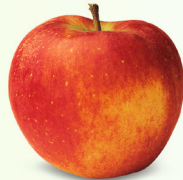
Elstar mittelgross, knackig, saftig September – März eher säuerlich