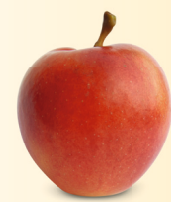
Mairac® Syn. La Flamboyante mittelgross, saftig Januar – Juni süss-säuerlich