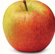
Gala mittelgross, sehr fest August – Juni süsslich