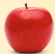
Jazz™ Syn. Scifresh mittelgross, knackig, saftig Oktober – Juni süss-säuerlich