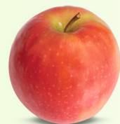
Pink Lady® Syn. Cripps Pink mittelgross, fest, saftig Dezember – Juni süss-säuerlich