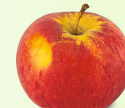
Rubinola mittel bis gross, fest September – Mai süsslich