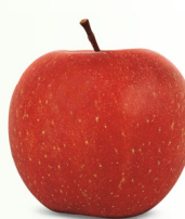
Kiku® Syn. Fuji Brak mittelgross, knackig Januar – Mai süsslich