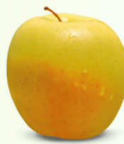
Tentation® Syn. Delblush mittelgross, fest, knackig November – März eher säuerlich