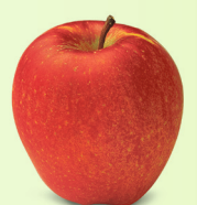
Maigold mittel bis gross, fest Oktober – August süss-säuerlich