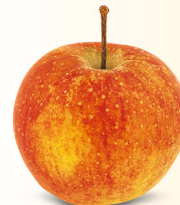
Rubinette mittelgross, saftig, würzig September – Januar eher säuerlich